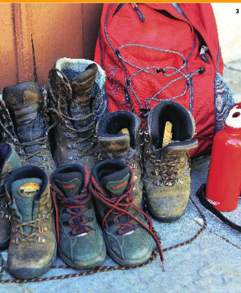
Kurze Rast in luftiger Höhe an einer Schutzhütte. 2 Hühner füttern, Hasen streicheln ... Die „Gîte Ferran“, einer von vier Übernachtungsorten, ein wahres Kinderparadies. 3 Stilleben mit Wanderschuhen. 4 Schön rausgeputzt: Esel Ouzo wurde von Emilia extra mit einer Blume geschmückt